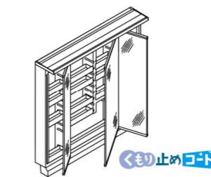
3面鏡(全収納・LED照明) MLCY1-903TXJU