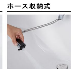
ホースを引き出して、ボウル手前に水を流すこともできます。