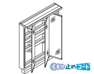
3面鏡(全収納・LED照明) MLCY1-753TXJU