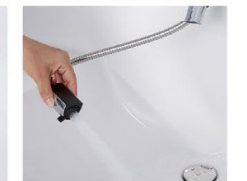
ホースを引き出して、ボウル手前に水を流すこともできます。