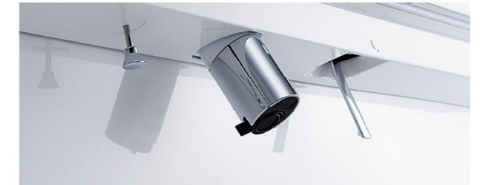
※写真は自動水栓タイプです。