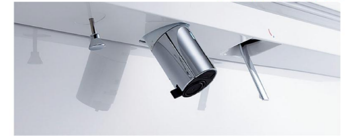
※写真は自動水栓タイプです。