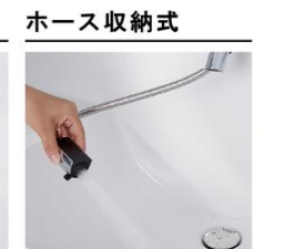
ホースを引き出して、ボウル手前に水を流すこともできます。