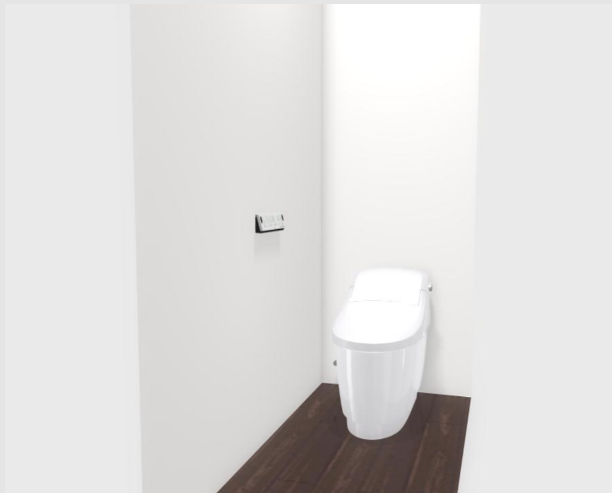
3DCGによるイメージ画像です。 反対壁に設置されている商品がある場合は表示されておられません。