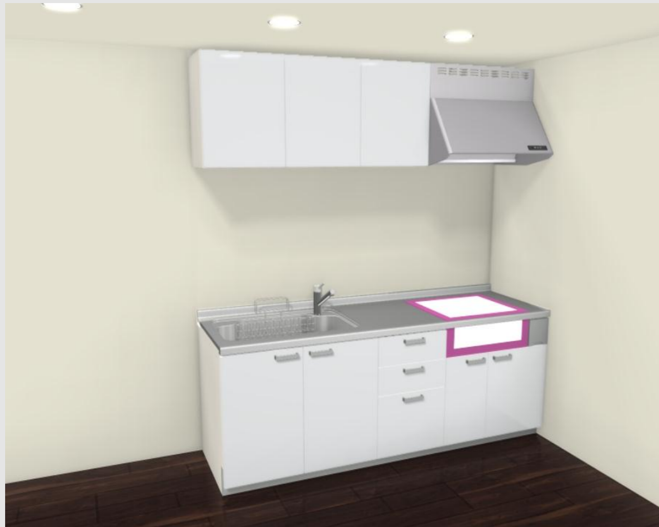
CG合成によるイメージ画像です。 現場調達品、シリーズ外選定品に関しては表現していません。