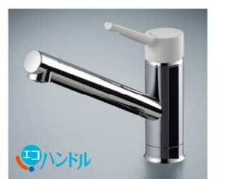
シングルレバー水栓 ノルマルレス・エコハンドル SFWL420SYXJGK