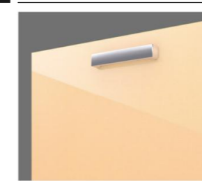
ショートハンドル取手