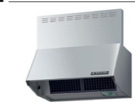
シルバー 加熱機器運動なし NBHシロッコファンタイプ NBH7386S1K